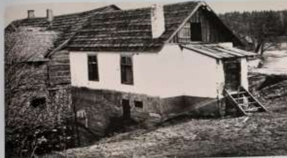
Mahajätkand Nursi hüdroelektrijaam umbes 1974. See ehitati ümber angerjalõksuks.